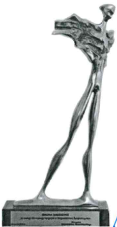
Nagroda „Wędrowiec Świętokrzyski” za zasługi dla rozwoju turystyki w Województwie Świętokrzyskim

Z up. BURMISTRZA Z-ca BURMISTRZA Piotr Ferens