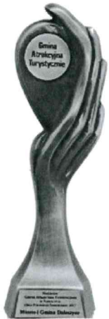
Gmina Atrakcyjna Turystycznie w Plebiscywie „Orły Polskiego Samorządu 2017”

W odpowiedzi na Pani petycję w sprawie likwidacji lub rozbudowy części chodnika przy drodze powiatowej w msc. Suków na wysokości posesji 55 A informuję, że Urząd Miasta i Gminy w Daleszycach wystąpił do Powiatowego Zarządu Dróg w Kielcach o przeanalizowanie sprawy pod kątem możliwości wykonania zabezpieczenia posesji przed zalewaniem wodami opadowymi.