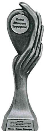
Gmina Atrakcyjna Turystycznie w Plebiscywie „Orły Polskiego Samorządu 2017”