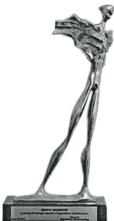
Nagroda „Wędrowiec Świętokrzyski” za zasługi dla rozwoju turystyki w Województwie Świętokrzyskim

Fundacja Rozwoju Obrotu Bezgotówkowego ul. Kruczkowskiego 4B lok. 13 00-412 Warszawa