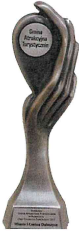
Gmina Atrakcyjna Turystycznie w Plebiscywie „Orły Polskiego Samorządu 2017”