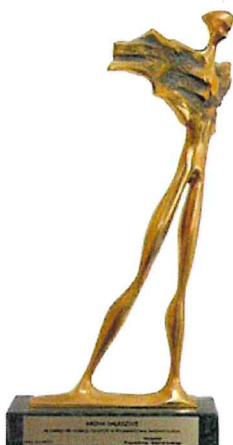
Nagroda „Wędrowiec Świętokrzyski” za zasługi dla rozwoju turystyki w Województwie Świętokrzyskim