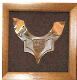
Nominacja do nagrody “Świętokrzyska Victoria” w kategorii “Samorządność” Kielce 2016