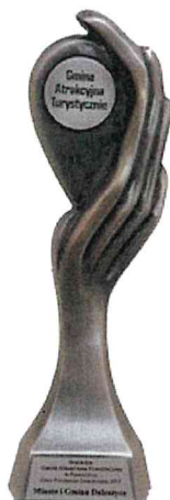
Gmina Atrakcyjna Turystycznie w Plebiscycie „Orły Polskiego Samorządu 2017”