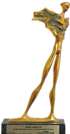
Nagroda „Wędrowiec Świętokrzyski” za zasługi dla rozwoju turystyki w Województwie Świętokrzyskim