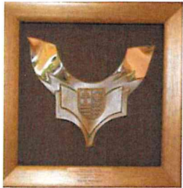
Nominacja do nagrody "Świętokrzyska Victoria" w kategorii "Samorządność" Kielce 2016