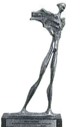
Nagroda „Wędrowiec Świętokrzyski” za zasługi dla rozwoju turystyki w Województwie Świętokrzyskim

Plac Staszica 9, 26-021 Daleszyce, Tel.: 41 317-16-94 | Fax: 41 317-16-93 | e-mail: gmina@daleszyce.pl