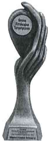
Gmina Atrakcyjna Turystycznie w Plebiscycie „Orły Polskiego Samorządu 2017”